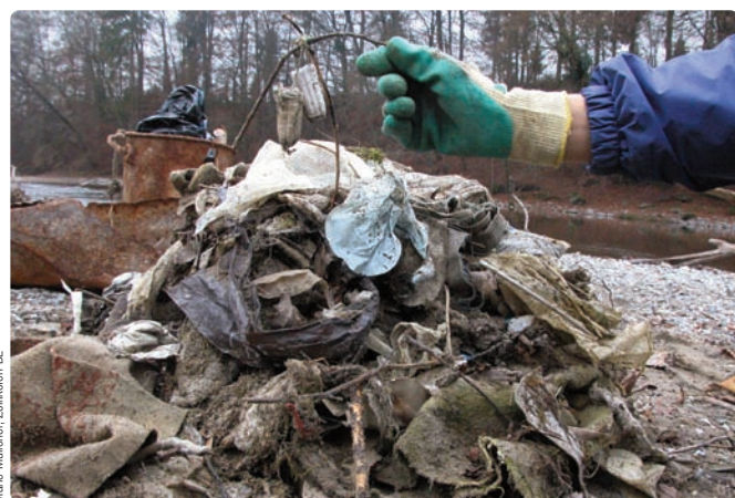
Marie Müllerer, Zollikofen BE

Elle a cependant pu noter un fait réjouissant pour sa rivière. A la fin 2007, elle a visité la STEP de Worblental, à Ittigen BE, et a pu y apprendre bien des choses sur les nouveaux aménagements de la STEP et les améliorations qui en découlent pour la qualité de l'eau. La capacité de la STEP a été augmentée ; elle dispose maintenant d'une réserve de capacité. Une grille fine a été installée à l'arrivée de la station, en plus de la grille déjà en place. Cette nouvelle grille retient des corps solides dès 3 mm de diamètre, qui peuvent ensuite être ame-