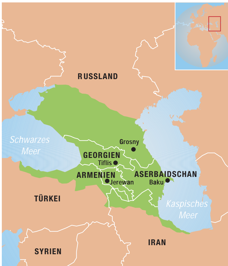
Der Kaukasus umfasst sechs Länder: Georgien, Armenien, Aserbaidschan, Russland, Türkei und Iran.

Der WWF ist laufend mit der Deklaration neuer Schutzgebiete beschäftigt. Internationale Geldgeber wie die norwegische und die deutsche Regierung bieten Unterstützung. Der seit 2000 bestehende Nationalpark Borjomi-Kharagauli setzt neue Massstäbe: Mit einem Besucherzentrum, Wanderwegen und Schutzhütten verfügt das 80 000 Hektar grosse Schutzgebiet über eine gute touristische Infrastruktur. Derzeit entstehen neue Schutzgebiete im Westen Georgiens, in Armenien sowie im russischen Teil des Kaukasus. Menschen gewinnen damit neue wirtschaftliche Perspektiven. Die Förderung nachhaltiger Waldnutzung, von sanftem Tourismus oder die Überwachung durch ausgebildete Ranger schafft Arbeitsplätze. Die Vernetzung von Schutzgebieten durch Korridore ermöglicht auch Arten mit grossem Flächenanspruch das Überleben, so zum Beispiel dem kaukasischen Leopard und anderen grossen Säugetieren. In Zukunft sollen vermehrt auch Schutzgebiete in aquatischen Lebensräumen deklariert werden.