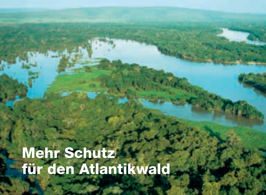
Mehr Schutz für den Atlantikwald