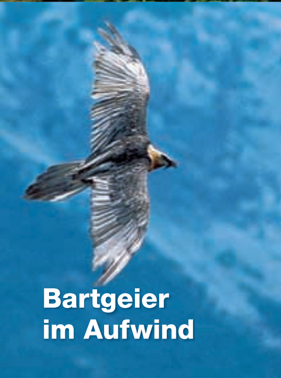
Bartgeier im Aufwind