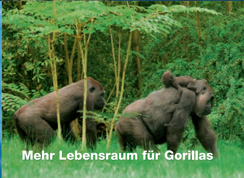
Mehr Lebensraum für Gorillas