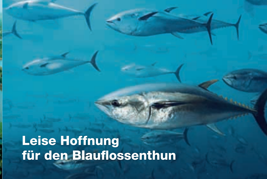
Leise Hoffnung für den Blauflossenthun