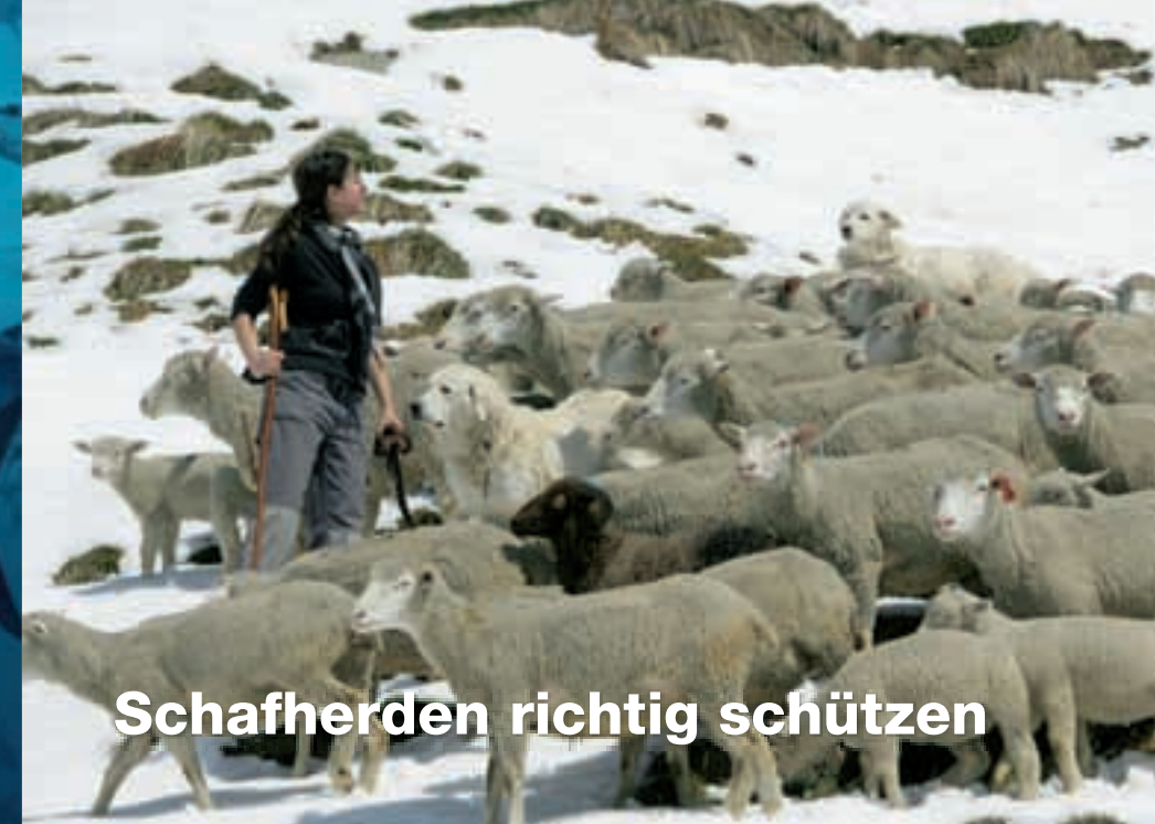
Schafherden richtig schützen