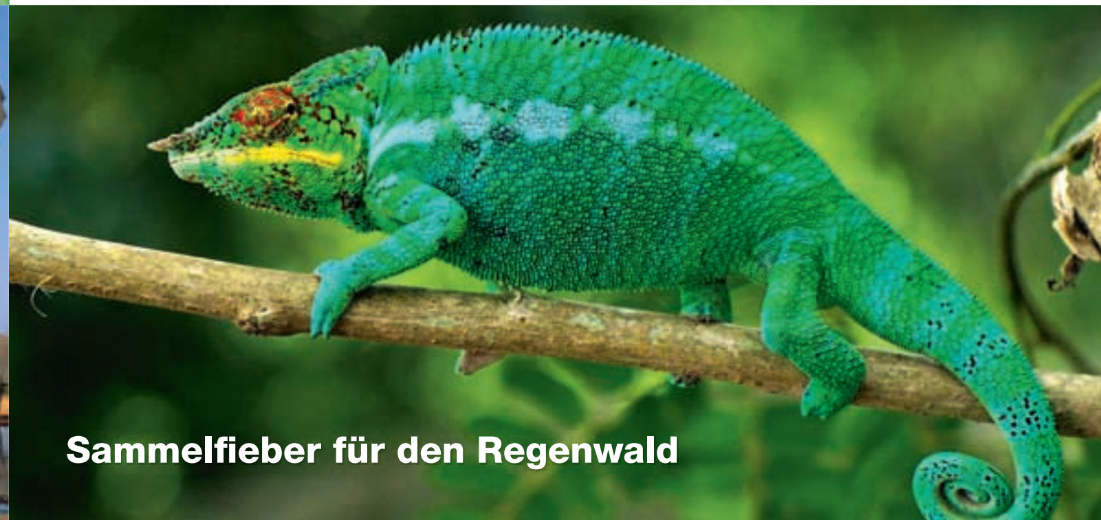
Sammelfieber für den Regenwald