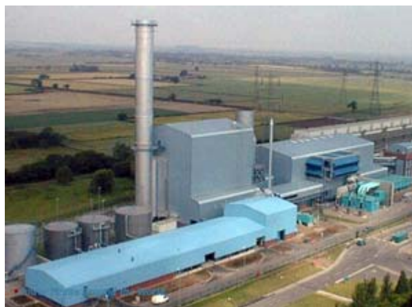
400-MW GuD-Kraftwerk, Nottinghamshire, UK, 1999

Mittellast-GuD-Kraftwerk: Mit Betriebszeiten von 2500 bis 5000 Stunden pro Jahr werden diese Kraftwerke mit maximalem Stromwirkungsgrad von knapp 60 Prozent betrieben. Hierzu wird eine Gas- und eine Dampfturbine (GuD) kombiniert. Typische Leistungskategorien betragen 400 und 800 Megawatt elektrische Leistung (MWe). Eine Wärmeauskopplung ist bei solchen Anlagen meist nicht vorgesehen. Grundsätzlich können diese Kraftwerke auch im Grundlastbetrieb, also ganzjährig, gefahren werden. Aufgrund der hohen Brennstoffkosten wird dies in Kontinentaleuropa selten gemacht.