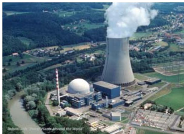
970-MW Kernkraftwerk, Gösgen, CH

Kernspaltung: Im Kernreaktor werden in Brennstäben Atome des Uran-Isotops Uran-235 mit Neutronen beschossen. Die Uranatomkerne werden gespalten und bei diesem Prozess wird Wärme freigesetzt.