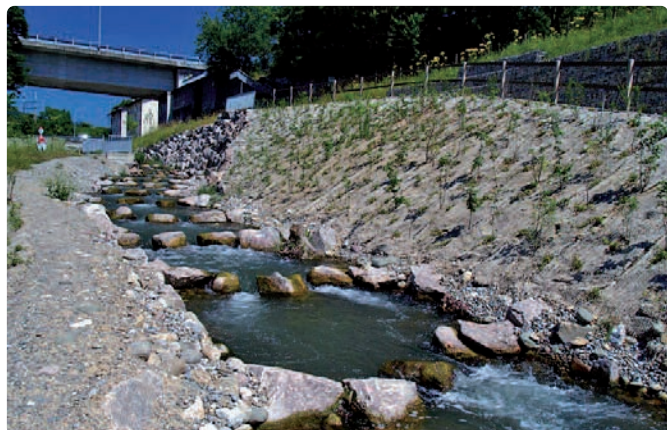
La passe à poissons de la centrale de Wettingen est particulièrement bien adaptée pour les petits poissons.

par les petits poissons, ce qui est rarement le cas. Les meilleures passes à poisson tiennent compte en outre des exigences d'autres animaux aquatiques, comme les crustacés ou les macro-invertébrés.