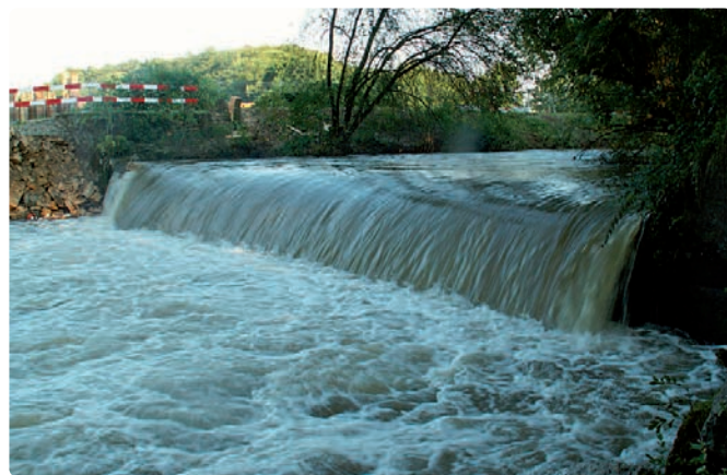
Sektion Jagd und Fischerei, Kanton Argau

L'eau coule vers le bas. Cette simple loi physique a des conséquences. La déclivité peut se présenter de différentes manières. Alors qu'il n'y a que certaines espèces de poissons capables de sauter qui peuvent passer des chutes (suivant leur hauteur et leur structure), les rampes et glissoires offrent le passage à d'autres d'espèces. Pour ces dernières, la rugosité, la longueur et la pente jouent un rôle décisif. L'idéal, c'est une forte rugosité, une faible pente et une longueur minimale. Un aménagement réussi a été réalisé à l'embouchure de la Suhre dans l'Aar, dans le canton d'Argovie. De 2005 à 2007, le canton d'Argovie a remplacé la chute la plus basse, insurmontable pour les poissons, par une rampe à blocs. Après ces travaux, le nase a pu recoloniser ses zones de frai originelles, et d'autres espèces ont également pu s'aventurer plus haut.