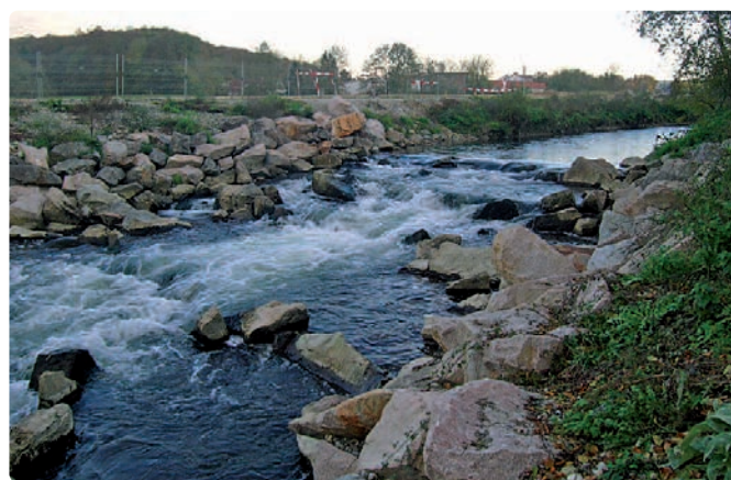
Sektion Jagd und Fischerei, Kanton Argau