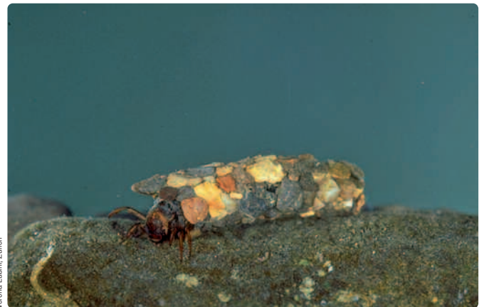
Köcherfliegenlarve mit Köcher ( Potamophylax cingulatus )

Köcherfliegen sind mit den Schmetterlingen verwandt und sehen den «Motten» sehr ähnlich, allerdings fehlt ihnen der charakteristisch eingerollte Saugrüssel der Schmetterlinge. Auch sind ihre Flügel nicht wie bei diesen mit breiten Schup-