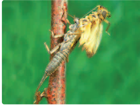
Steinfliege am Schlüpfen. Die noch gefalteten Flügel werden sichtbar.