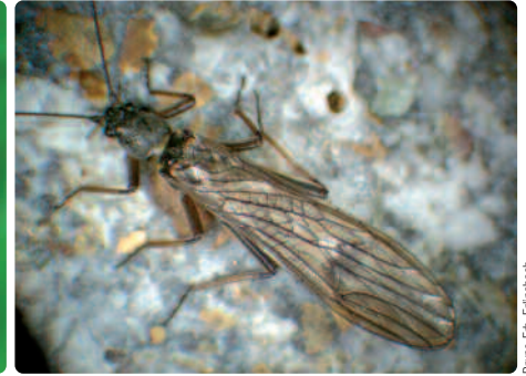
Adulte Steinfliege ( Rhabdiopteryx neglecta )