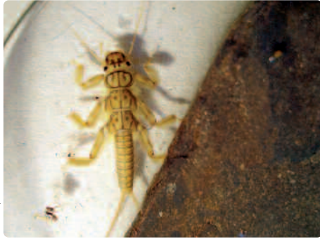
Steinfliegenlarve ( Dinocras sp.)