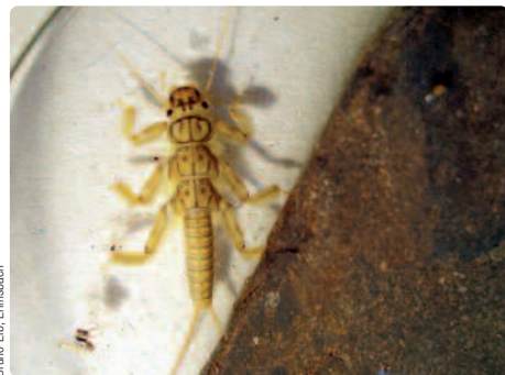
Una larva di Plecotteri ( Dinocras sp. )