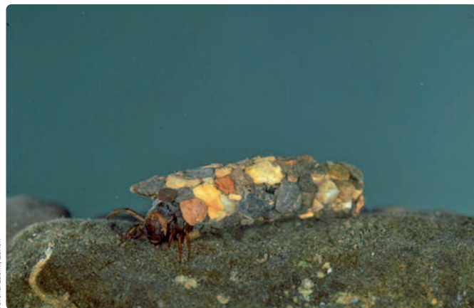
Una larva di Tricotteri con nido ( Potamophylax cingulatus )

I Tricotteri si confondono con le farfalle e sono molto simili alle falene, anche se manca la caratteristica spiritromba delle farfalle. Anche le ali non sono così coperte da larghe scaglie, ma da fini peli. Le coppie di ali, entrambe marroni, vengono pie-