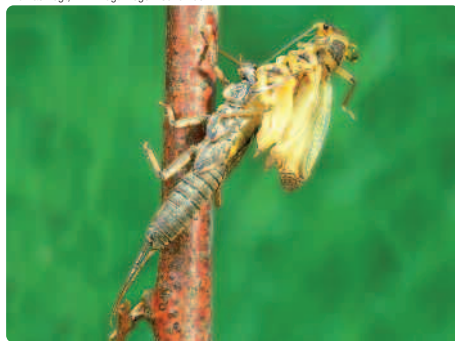
I Plecotteri spiega le ali e vola via.