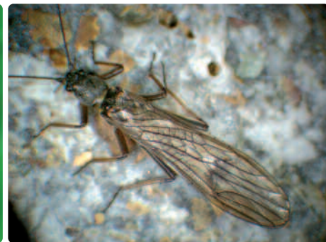
I Plecotteri adulti ( Rhabdiopteryx neglecta )