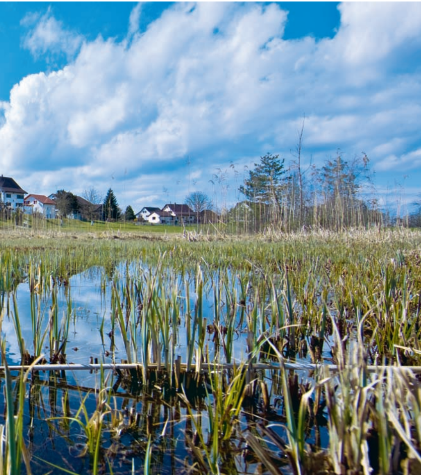
Die Drumlinlandschaft Zürcher Oberland. Eine der 162 schützenswerten Landschaften der Schweiz.