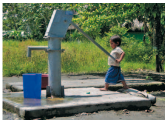
Pompe d'eau fraîche dans un village Candoshi

Le WWF n'aura de cesse de batailler pour que l'Etat respecte ses promesses. Ce plan sanitaire permet non seulement de sauver des vies, mais également de mettre en œuvre le programme de gestion des ressources de la pêche – pour que les Candoshi puissent continuer à vivre des richesses naturelles de leur lac, une tradition multiséculaire.