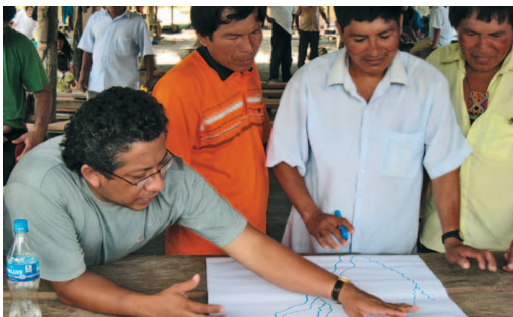
Discussions des habitants d'un village sur le programme de gestion des ressources piscicoles

Les Candoshi ont officiellement obtenu le droit d'exploiter les ressources de la pêche il y a plusieurs années. Le programme de gestion de ces ressources élaboré avec l'aide du WWF prévoit que seuls les pêcheurs autorisés peuvent capturer du poisson, à des horaires et en des lieux précis, et en respectant une taille minimale et des quotas quantitatifs. La pêche et la population des quatre grandes espèces de poisson sont surveillées. Des contrôleurs nommés par les villages sont habilités à signaler les infractions aux autorités. Dans certains cas d'urgence, les Candoshi ont néanmoins eux-mêmes un intérêt à l'illégalité. Il arrive ainsi qu'ils cèdent chèrement une autorisation de pêche – en fait caduque – contre une somme importante. Cette source de revenus est souvent le seul moyen pour eux de réunir la somme nécessaire au traitement d'un des leurs souffrant d'hépatite