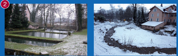
2 Nom: Dorfbach Busslingen | Localité: Stetten dans le canton d'Argovie Projet: Les bassins d'élevage piscicole ont été supprimés en 2010 afin de permettre la renaturation du ruisseau du village.