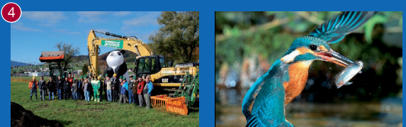
4 Nom: Linth | Localité: Tuggen dans le canton de Schwyz Projet: Le projet revitalise marais et cours d'eau, sauvant ainsi les habitats de poissons, d'amphibiens et d'oiseaux.