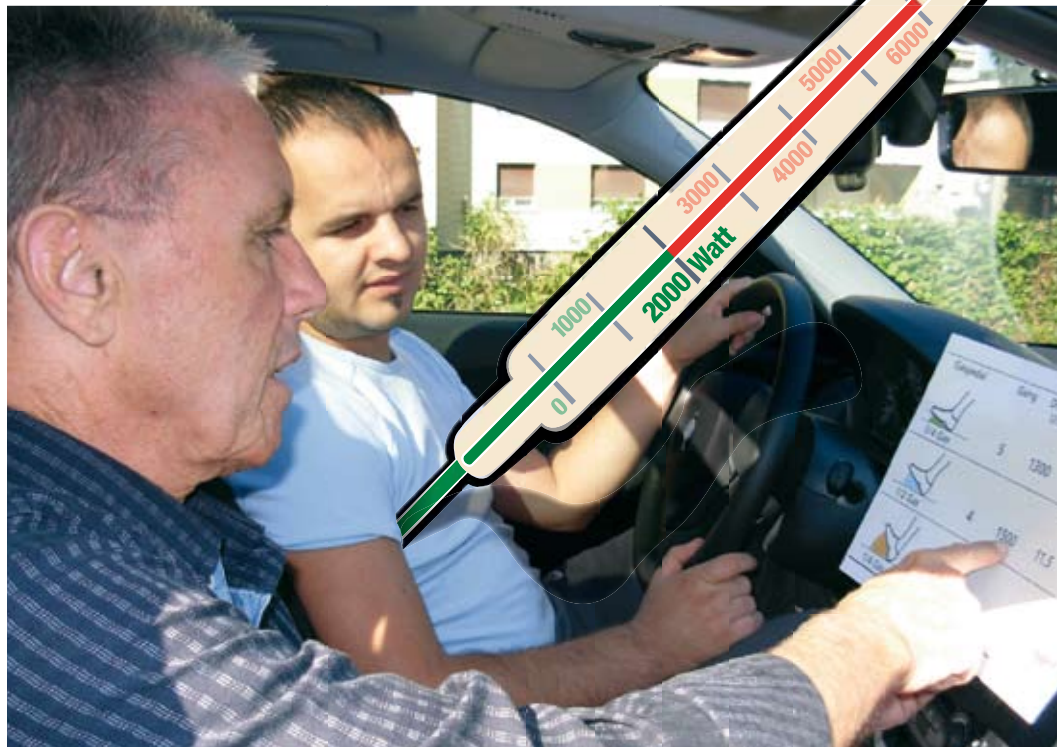
Umweltschonendes Fahren wird zum Standard der Fahrschulausbildung.