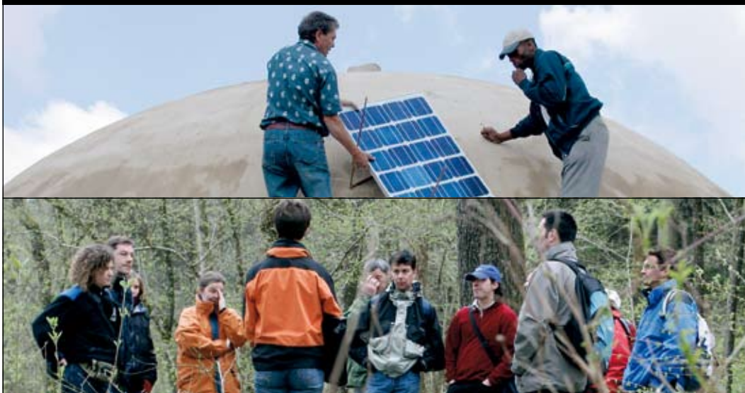
Tagungen, Fachkurse und Lehrgänge: Klimaschutz als Bildungsauftrag.