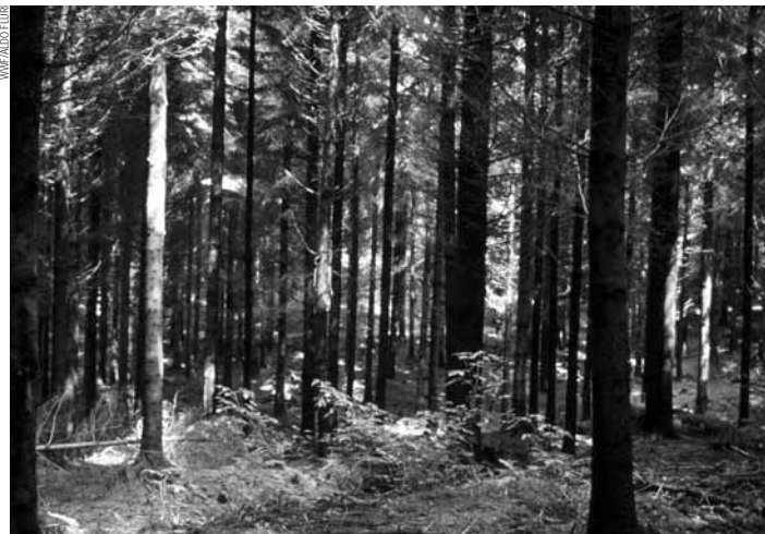
Monoculture de sapin