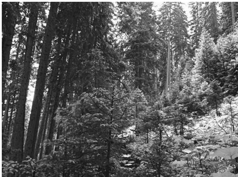
Rajeunissement naturel d'une forêt

Voilà déjà plusieurs dizaines d'années que les forêts suisses sont généralement exploitées en respectant la nature. Les interventions et mesures d'entretien sont effectuées en fonction des processus naturels. Aujourd'hui, toutefois, sous la pression croissante des intérêts économiques, des voix s'élèvent pour réclamer moins de prescriptions et davantage de flexibilité d'exploitation pour les propriétaires de forêts. Mais l'économie et l'écologie sont-elles réellement en opposition dans la forêt ?