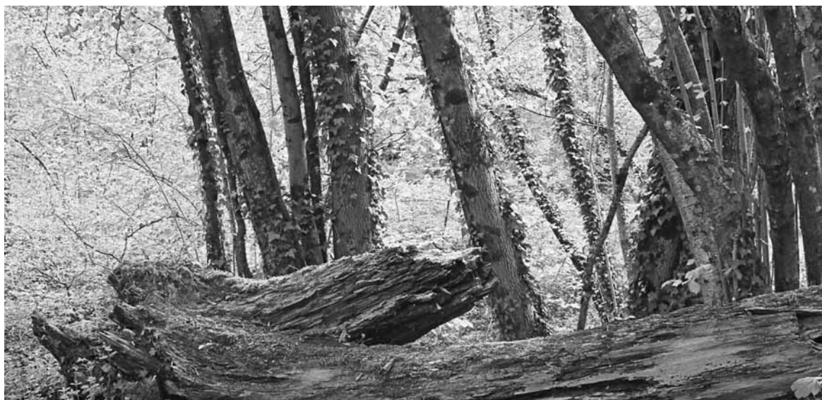
Exemple d'une sylviculture proche de l'état naturel, avec du bois mort

La sylviculture proche de la nature, telle qu'elle est pratiquée aujourd'hui, subit de plus en plus souvent des attaques de la part de certains milieux qui lui reprochent de contribuer aux difficultés économiques des exploitations forestières. En règle générale, ceux qui en font état se gardent bien d'étayer ce reproche qui ne s'avère guère fondé, mais qui fait son chemin et reste solidement ancré