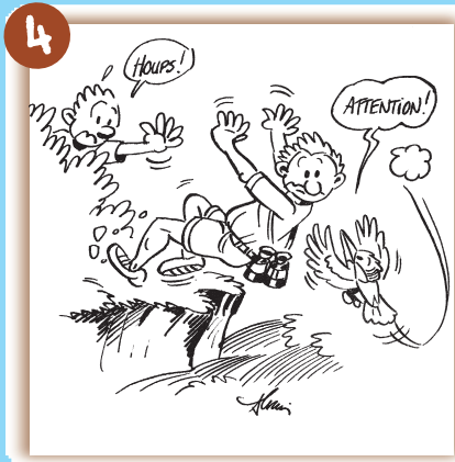
Je ne chahute pas au bord de l'eau, je n'éclabousse pas mes camarades.