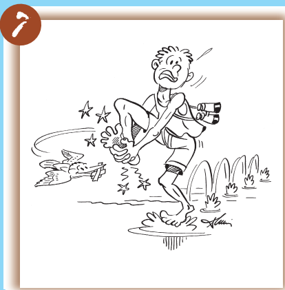
Je ne marche jamais pieds nus.