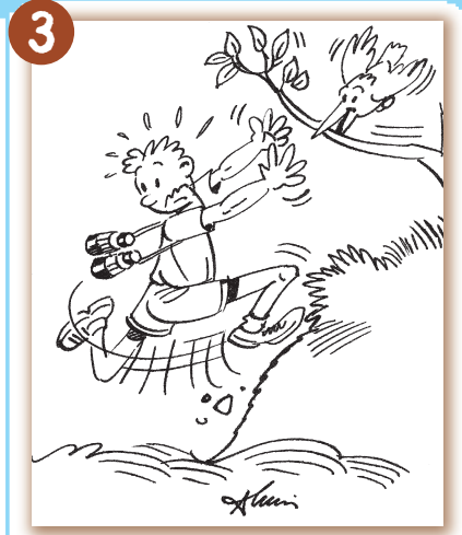
J'évite les berges glissantes ou instables.