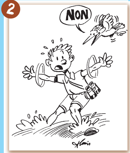
Je ne marche pas dans l'eau.