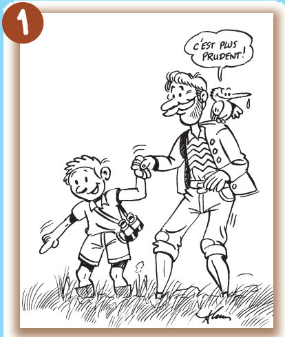
Je pars toujours accompagné d'un adulte. Je reste proche du groupe.