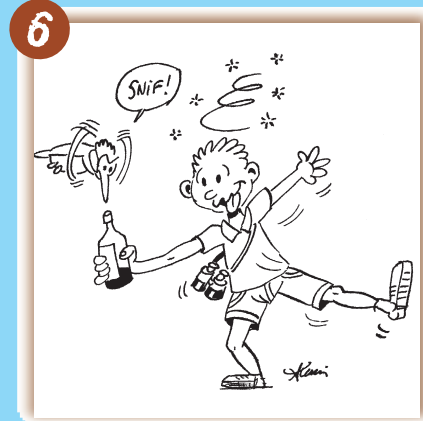
Je n'ouvre pas les bouteilles ou bidons que je découvre, je ne bois ni ne respire leur contenu.