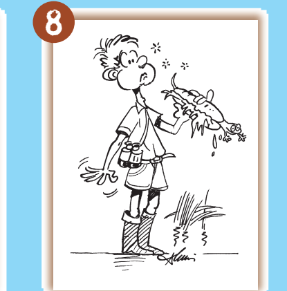
Je ne bois pas l'eau de la rivière et je ne mange pas pendant mes observations.