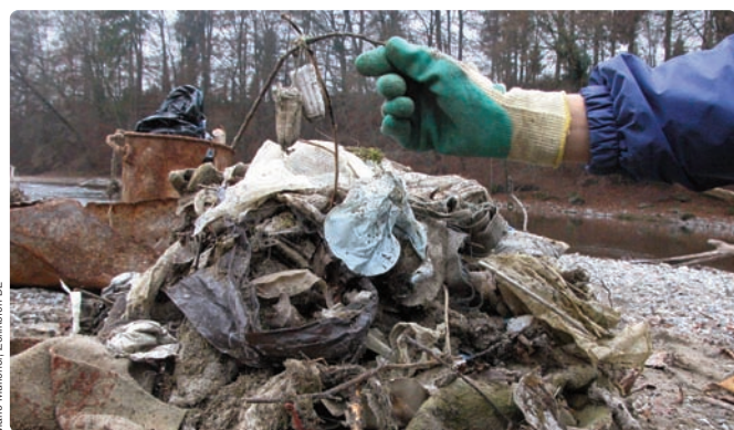
Marie Müllener, Zollikofen BE

Marie Müllener konnte aber auch einen Gewinn für ihren Fluss, die Aare, in Bezug auf die Wasserqualität verbuchen. Sie besuchte Ende 2007 die ARA Worblental in Ittigen BE und konnte dort einiges über den Ausbau der ARA und den daraus resultierenden Erfolg für die Wasserqualität erfahren. Die Kapazität der ARA wurde erhöht und verfügt nun über eine Kapazitätsreserve. Im Zulauf der Anlage wurde ausserdem