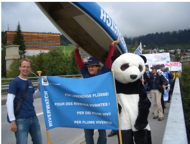
Evénement final à Flims

En septembre, nous avons présenté aux médias, avec 30 gardes-rivière, les résultats de la première phase de Riverwatch. Vos observations ont permis d'établir un bilan expressif et il s'est avéré que le rapport à nos cours d'eau doit être fortement amélioré dans de nombreux domaines. A cet effet, des exigences ont été formulées à la confédération, aux cantons, aux communes et aux politiciens. Nous aimerions vous remercier sincèrement pour votre grand engagement. Sans votre aide, ce bilan n'aurait pu être établi. Toutefois, nous ne souhaitons pas uniquement poser des exigences. A présent, notre objectif est de nous engager intensément pour les cours d'eau vivants : dans une deuxième phase de Riverwatch, nous visons à libérer le plus grand nombre de cours d'eau en Suisse, grâce à vous, aux gardes-rivières, et au WWF!