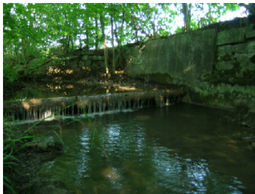
Alte Lorze

Dopo aver ulteriormente chiarito la situazione politica con la sede di Zugo del WWF, i due guardafiumi vogliono muoversi per piccoli passi. La loro prossima mossa sarà prendere contatti con alcuni membri del Consiglio Cantonale, per informarli sui vantaggi del progetto di deviazione idrica e per scoprire a quali altri membri del Consiglio rivolgersi.