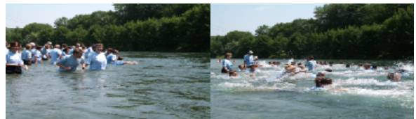
Big Jump 17 luglio 2005 nella Limmat presso Zurigo

Punto d'incontro: ore 14:30 Lorrainebad Berna Programma: ore 15:00 Nuotata nel fiume Aar Altenbergsteg-Lorrainebad ore 15:30 grigliata dalle ore 17:00 ca. musica