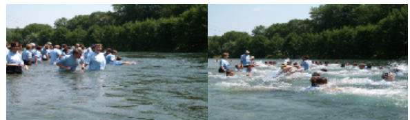
Big Jump 17 juillet 2005 dans la Limmat, près de Zurich